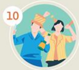
ปาร์ตี้สังสรรค์ กับเพื่อนฝูง