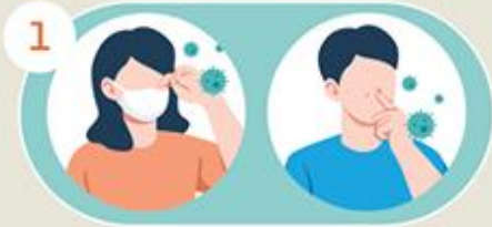
ขยี้ตา และจมูก