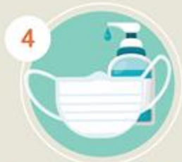
ไม่พกหน้ากากผ้า เจลล้างมือ