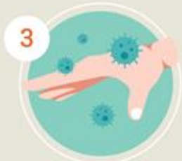
หยิบจับสารพัด แต่ไม่ล้างมือ